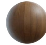
Piso SPC en recámaras