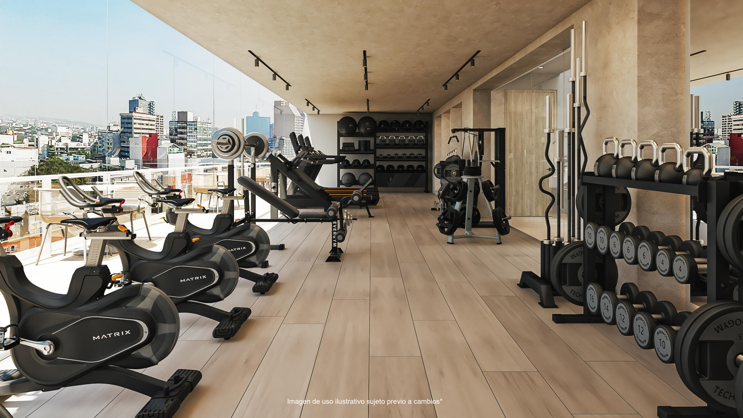
Imagen de uso ilustrativo sujeto previo a cambios*