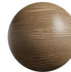
Melamina Mod "Copal"