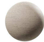
Mármol en Cocinas y Baños