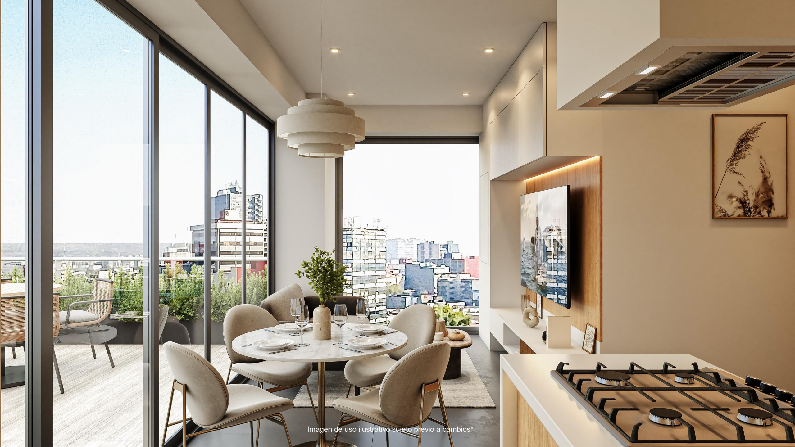
Imagen de uso ilustrativo sujeto previo a cambios*