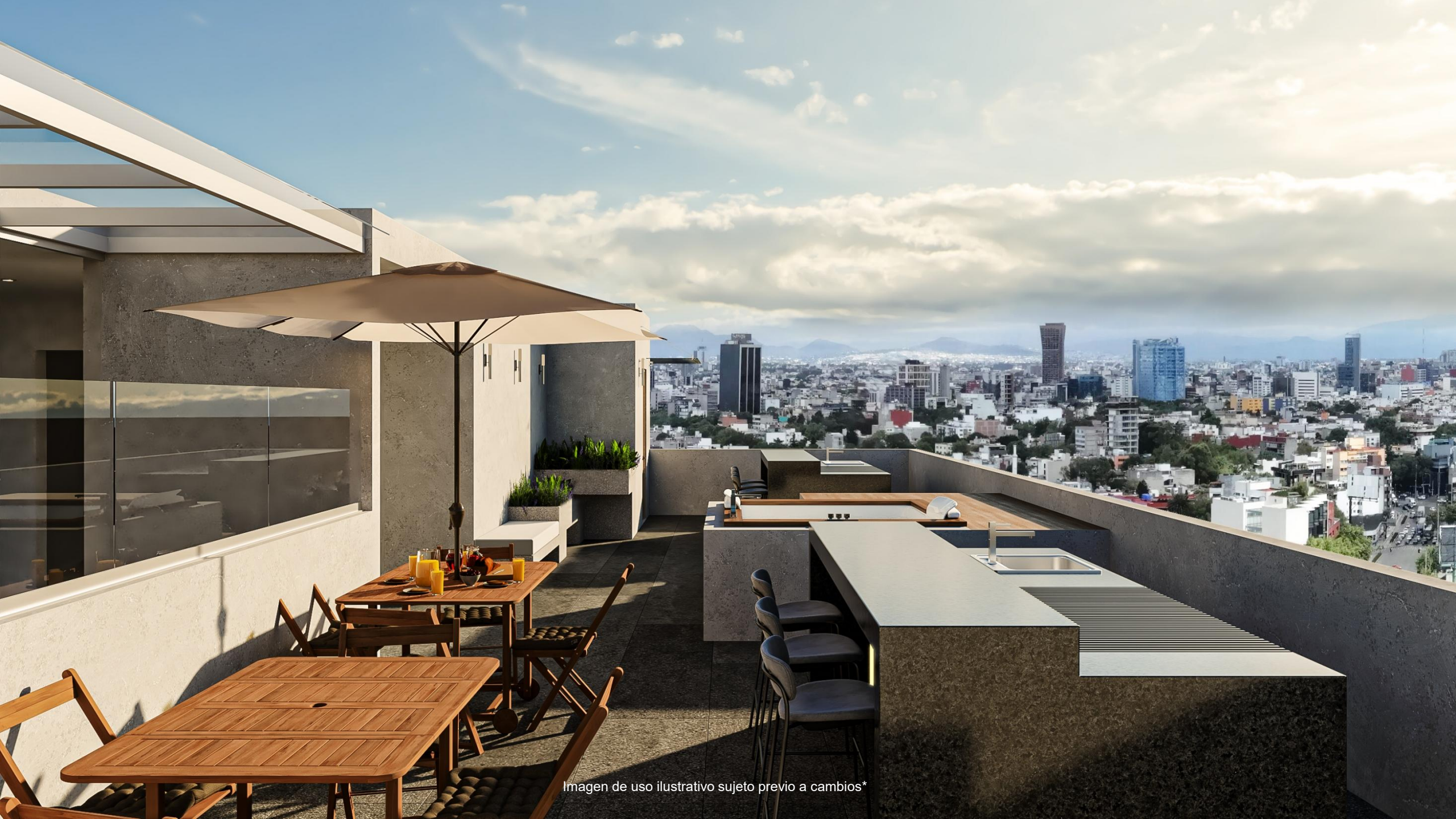
Imagen de uso ilustrativo sujeto previo a cambios*