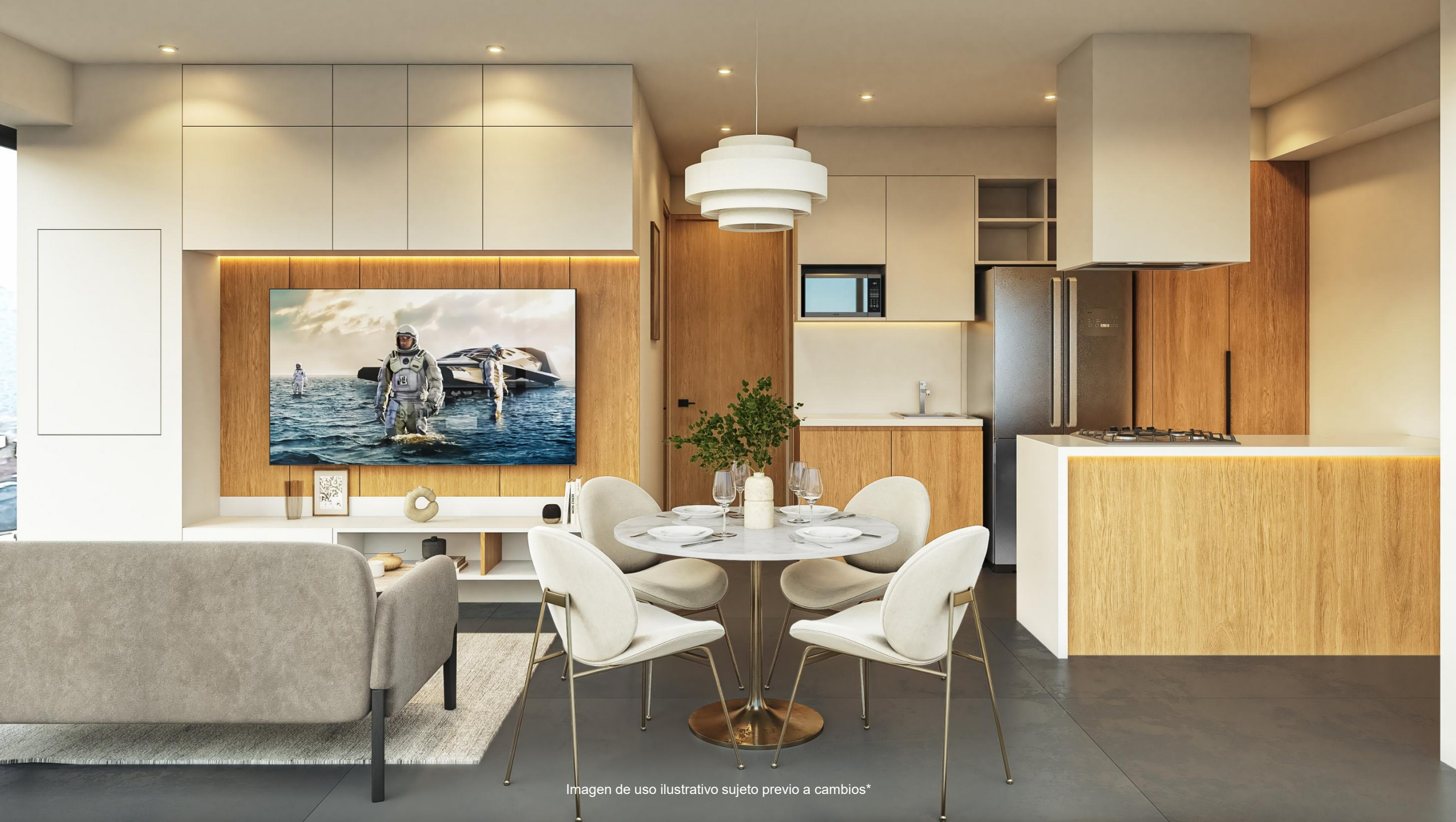
Imagen de uso ilustrativo sujeto previo a cambios*