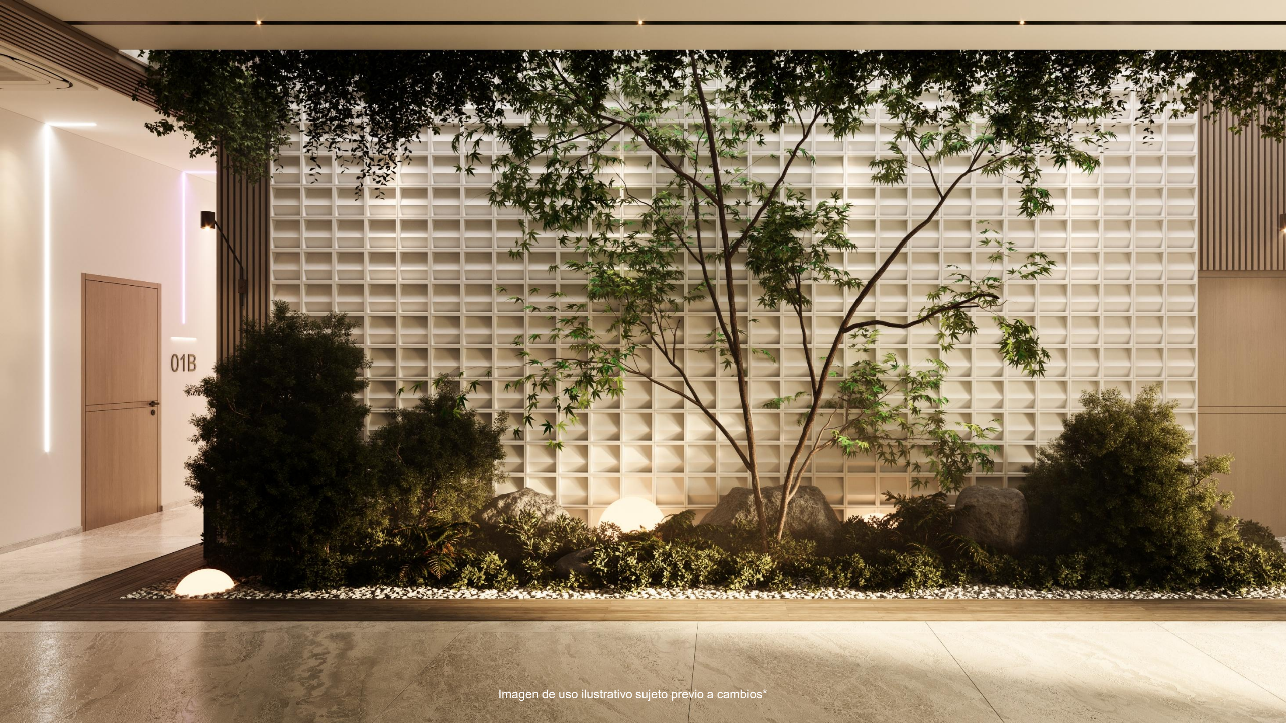
Imagen de uso ilustrativo sujeto previo a cambios*