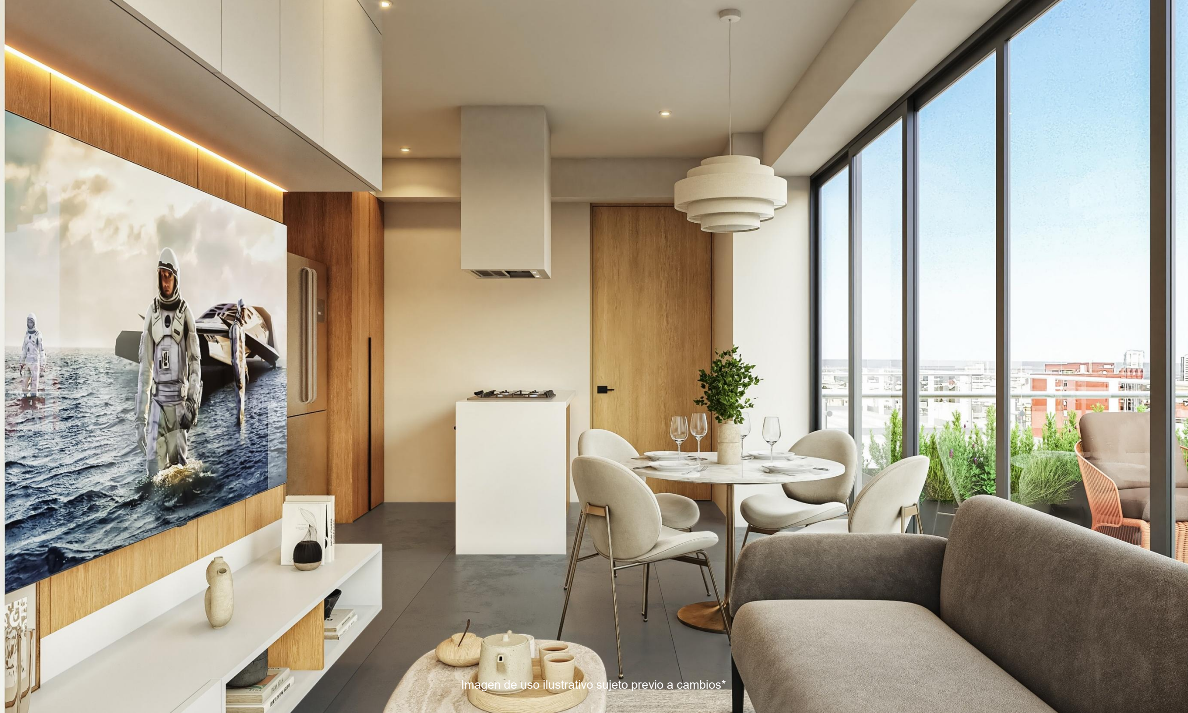
Imagen de uso ilustrativo sujeto previo a cambios*