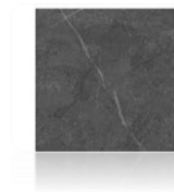
Porcelanatos en Sala y Comedor